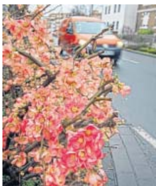
An der Hansastraße: Ein Quittenbusch blüht tiefrosa mitten im Dezember.

■ Herford (nw). Das milde Weihnachts-Winter-Wetter macht es möglich: ein Quittenstrauch an der Hansastraße blüht derzeit in einem kräftigen Pink-Rosa-Violett. Dabei blüht die Quitte eigentlich nur in einem kurzen Zeitraum im Mai und Juni. Der bisher ausgebliebene Winter sorgt nun offenbar dafür, dass die Pflanze ein wenig durch-einander gekommen ist. Quitten stammen ursprünglich aus dem Kaukasus und bilden Früchte, die Äpfeln ähneln.